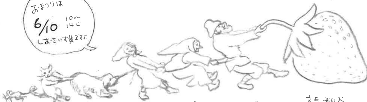
あみきな いちご？ 文貴 米田谷

フラフェス用の服 いすみやのリサイクルは だいぶ品薄になりました。 残り少しですがお探しの方は、 朝(8:45～9:30)に見に 行って見て下さい。 尚、赤らみ～幼児(110まで) サイズは 子どもの園のリサイクル ルームにあります。(海)